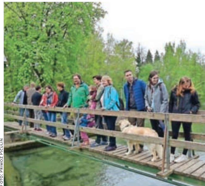
Za preddvorsko območje so značilne čiste vode.