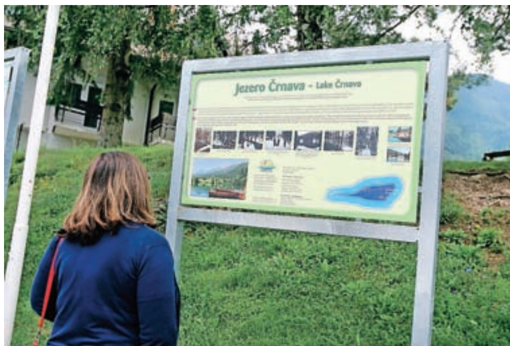
V razvojni strategiji ima posebno prioriteto območje jezera Črnava.

Turizem je v občini Preddvor prepoznan kot glavna perspektivna panoga, pri tem pa govorimo predvsem o zelenem trajnostnem turizmu. V občinskem prostorskem načrtu so predvidene možnosti za prenavo in širitev hotelske dejavnosti, vendar se vsi nagibamo k okolju prijaznim, ne preveč množičnim oblikam turizma. Zato smo predvideli ukrep, da bi občina podpirala zasebnike, ki bi se odločali za vlaganja v manjše, butične turistične namestitve.