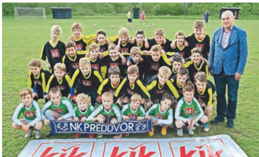
Spravimo otroke z ulice!

Čeprav smo vsi prihodnji uporabniki navdušeni nad novo podobo šolskih športnih igrišč, pa si v ŠD Preddvor želimo, da bi čim prej uredili tudi razsvetljava, s čimer se bo podaljšal čas uporabe predvsem v jesenskem in zimskem obdobju. Potrkati je treba tudi na zavest bodočih uporabnikov, da se morajo na igriščih obnašati v skladu s športnimi pravili in redom, da bi bila uporabnost čim dolgot-