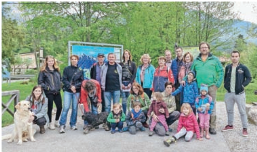
Udeleženci po poteh preddvorskih voda

»Vodni dogodek« bodo v Preddvoru ponovili ob bližnjem Pohodniškem festivalu Kamniško-Savinjske Alpe, ki bo od 23. do 26. junija v občinah tega območja. Na pohod ob štirih preddvorskih vodah (Kokra, Suha, Bistrica, jezero Črnava) se bodo podali v soboto, 25. junija, ob 9. uri, ponovno s kolesarskega počivališča Hrib.