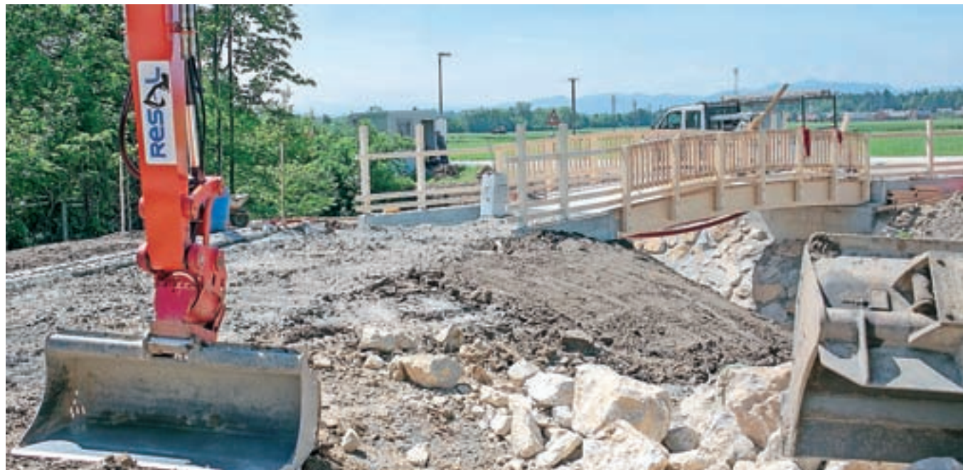
Gradnja mostička v grajskem parku

telj in s tem tudi približno 20 delovnih mest. Upam, da nam bo uspelo v gradu Dvor pravočasno zagotoviti manjkajoče postelje in tudi delovna mesta. Tako bi bil grad Dvor nekakšna depandansa Doma starejših občanov Preddvor in bi bila tudi pod njegovim upravljanjem. Poleg tega bi želeli pridobiti v gradu tudi muzej slovanstva, kajti nad Bašljem imamo arheološko najdišče, kjer se obeta zelo bogata najdba iz 8. stoletja. To bi bil muzej nacionalnega obsega. Poleg tega bi bili v gradu