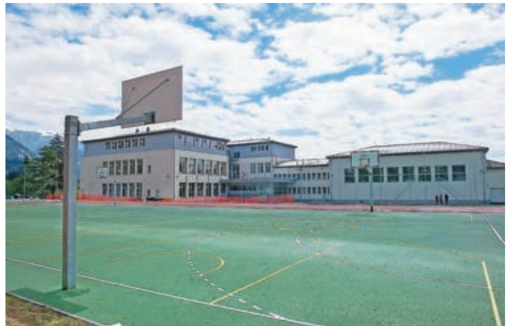
Preddvorski šolarji in športniki so dobili nova športna igrišča.

Preddvor – Prve dni septembra je zaradi dotrajanosti starega igrišča veljala prepoved uporabe, 9. maja lani pa so zabrnili gradbeni stroji. Tako so bili starejši učenci kar devet mesecev prikrajšani za vadbo zunaj, mlajši pa so zaradi prezasedenosti telovadnice namesto na športnem igrišču telovadili v učilnicah, gostovali v telovadnici vrtca ali pa se razgibavali ob otroških igralih in na njih. Najbolj navdušeni nogometaši iz podaljšanega bivanja so si zasilen žogobrc privoščili kar na zelenici med šolo in vrtcem ali celo v kotičku otroškega igrišča. Običajno večina šolarjev od tretjega razreda navzgor rekreacijski odmor – če le vreme to dopušča – preživlja zunaj. Nadihajo se svežega zraka in potrošijo odvečno energijo, kar jim omogoča boljše zbrano pri urah v šolskih klopeh. Številni fantje sicer v šolo prihajajo pol ure prej, da pred poukom še malo brcajo žogo, pa tudi po pouku nekateri zaradi iste dejavnosti kar ne znajo domov ... Letos so pač prostor za sproščanje odvečne energije in druženje morali poiskati drugje. Seveda smo se obnove igrišča tako šolarji kot tudi zaposleni zelo razveselili, čeprav se