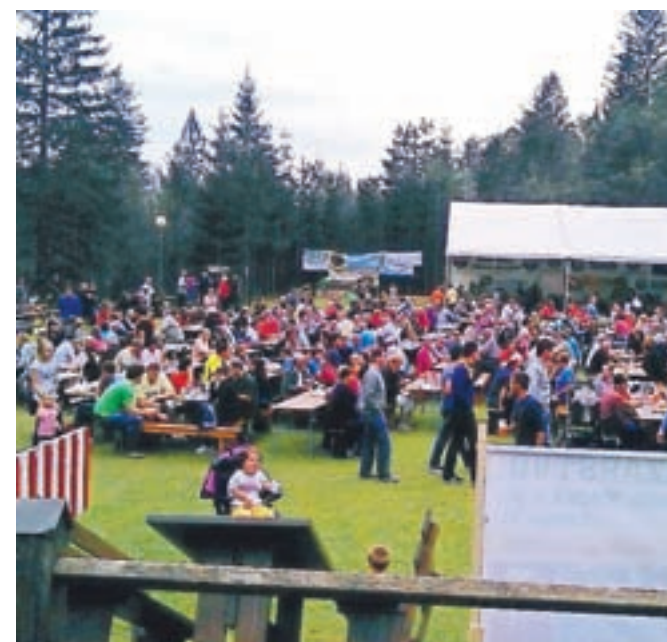
S kmečkega praznika pod Storžičem

Vaško veselico organiziramo 27. in 28. avgusta, 27. avgusta bašljanski fantje organizirajo večer z ansamblom, 28. avgusta pa že 31. tradicionalno prireditev Kmečki praznik pod Storžičem. Pokazali bomo življenje in delo nekoč, kmečke žene bodo ustvarjale domače dobrote, drugi Bašljani bodo kot vedno aktivni povsod, da veselica uspe, bodo pripravili bogat srečelov. Dobrodošli v Bašlju 27. in 28. avgusta na nogometnem igrišču pod šotorom ... Fletn' n'm bo.