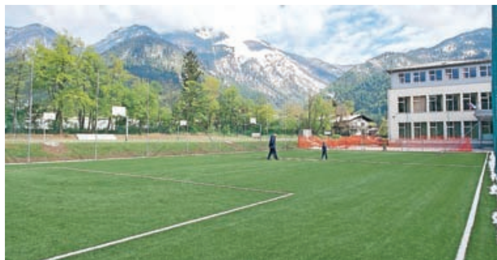
Dočakali so nova šolska športna igrišča.

25. junija – prvenstvo Občine Preddvor v malem nogometu