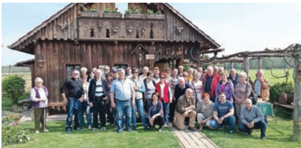
Preddvorski čebelarji na nedavni strokovni ekskurziji