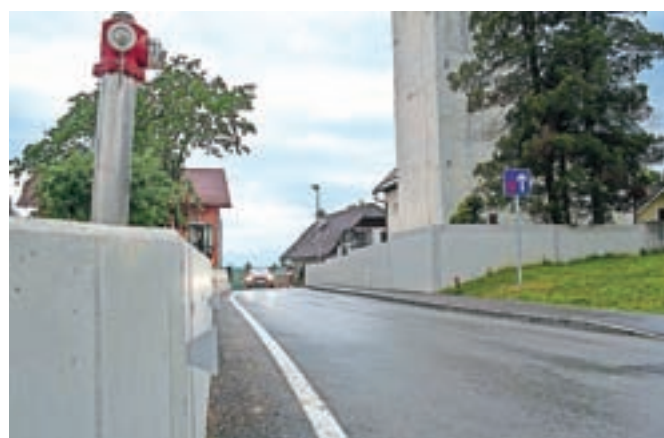
Med vasmi, kjer je po gradnji infrastruktura celovito urejena, je tudi Srednja Bela.