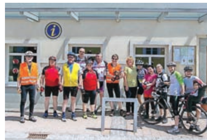
Kolesarski postanek v Preddvoru

Na kolesarskem izletu po podeželju so se udeleženci ustavili v Preddvoru in pokusili domačo jed – posmodulo.