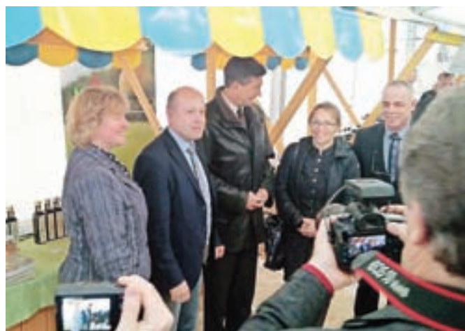
Preddvorsko stojnico je na sejmu v Komendi obiskal tudi predsednik države Borut Pahor.