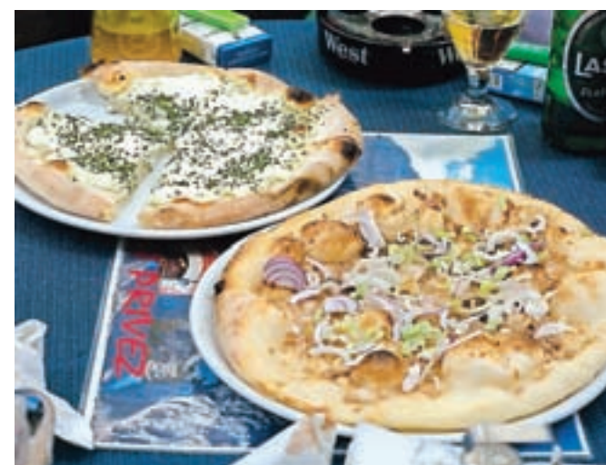
Ni pica, pač pa posmodula.

Kolesarji so nato nadaljevali skozi Predoslje in izlet sklenili v Kranju. Udeleženci so prevozili 43 km, naredili pet postankov in na štirih mestih pokusili domačo lokalno hrano. Kolesarske vožnje se je udeležilo 15 kolesarjev vseh starosti. Ker je bil lep sončen dan, so med potjo lahko občudovali lepoto krajev pod Storžičem, ki so že sicer pogost cilj ali postanek na kolesarskih poteh.