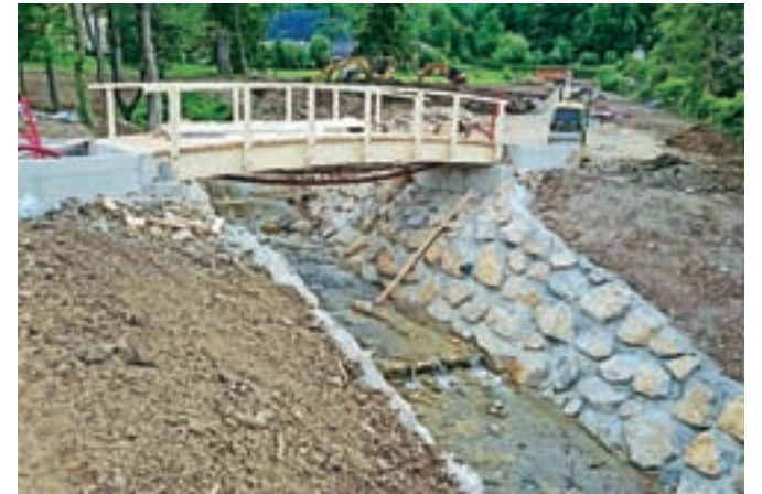
Ali se ne bi dalo narediti drugače?

Pa še malo o lepših straneh naših voda. Vsekakor sta to