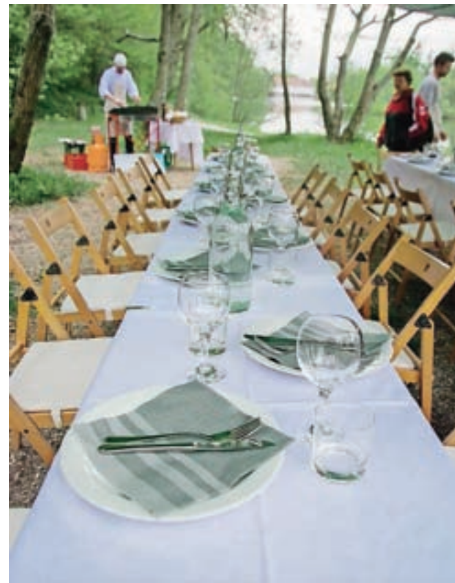
Pogostitev ob t. i. neskončnih mizah