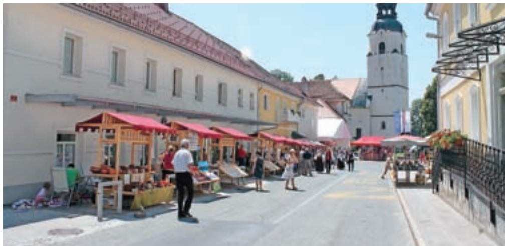
Na lanskem Petrovem s'mnu