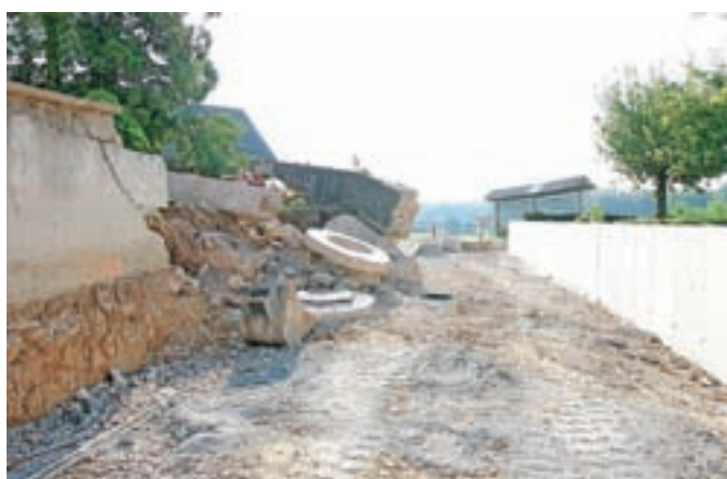
Neprepoznava okolica med gradnjo infrastrukture v petih vaseh v občini

okviru projekta, imenovane Infrastruktura v Občini Preddvor, zgradili 11.600 metrov fekalne in 6584 meteorne kanalizacije in obnovili 862 metrov vodovoda, poleg tega so se uredile ceste, pločniki, javna razsvetljava, zaščitne ograje, avtobusna postajališča, naselja so se celostno uredila in pridobila novo, lepšo podobo. Sedaj zaključujejo še geodetske odmere in urejajo zadnje podrobnosti. V teh dneh so v središču petih vasi, ki so bile vključene v projekt, ki ga je finančno znatno podprl evropski kohezijski sklad, kot simbolični zaključek del posadili lipe.