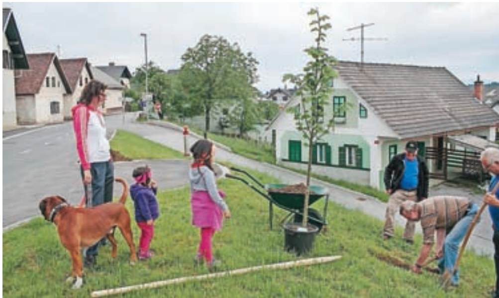
V vaseh, kjer se je končalo celovito urejanje infrastrukture, so pred občinskim praznikom zasadili lipe. Na sliki je sajenje lipe v Tupaličah.

Preddvor – Na praznični dan, 1. junija, bodo pri Osnovni šoli Matije Valjavca Preddvor slovesno odprli pravkar obnovljena športna igrišča in pripravili kulturni program. Popoldne bodo sledila tekmovanja na novih športnih površinah. Naslednji dan, 2. junija, bo na Povšnarjevi domačiji v Kokri odkritje spominske plošče. Občina Preddvor in Policijsko veteransko združenje Sever Gorenjska se bosta z njo oddolžila domačinom, ki so v letih 1990 in 1991 skrivali policijsko orožje, da ga ne bi zasegla Jugoslovanska armada. Tega dne zvečer bo maša za domovino in ob tej priložnosti tudi blagoslov končanin del v občini. Ob letošnjem občinskem prazniku namreč simbolno zaključujejo dela ob največji investiciji zadnjih let, vlaganji v infrastrukturo v petih vaseh. Ob končanju del so v vaseh, ki so s to naložbo največ pridobile, posadili lipe, ki so dale piko na i končni podobi urejenih krajev. Temu bo 5. junija sledilo športno srečanje generacij v rokometu.