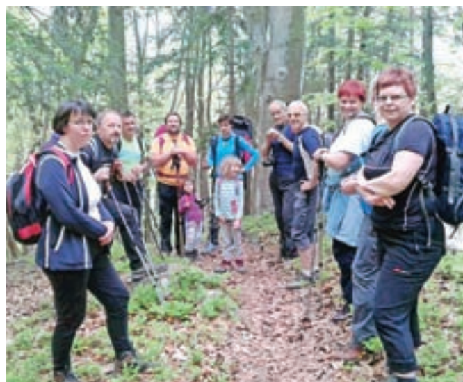
Pohodniki iz Kokre na Sv. Jakoba

Kokra – Sveti Jakob nad Katarino je eden najprikupnejših gričev s cerkvico v okolici Ljubljane, zato smo se člani TD Kokra odločili, da v nedeljo, 17. aprila, organiziramo pohod. Zbor je bil v Kokri, na parkirišču pred cerkvijo, od koder smo se odpeljali proti Medvodam, mimo vasi Sora do gostilne Legastja. Tam smo parkirali in previdno prečili cesto, nato pa se usmerili na pešpot v smeri Sv. Jakoba. Pot nas je vodila mimo kmetij in nad polji. Po dobri uri smo prispeli na vrh, kjer smo se odpočili. Tam sta tudi vpisna knjiga in žig. Z vrha smo se naužili lepega razgleda na Polhograjsko hribovje in del Kamniško-Savinjskih Alp. Potem smo se spustili do vasi Topol, kjer smo imeli okrepčilno kosilo v gostilni na Vihri. Spust do Sv. Katarine in navzdol do parkirnega prostora je trajal še približno eno uro. Razšli smo se prijetno utrujeni, dobre volje, vsi pa smo bili mnenja, da se veselimo novega potepanja po lepih slovenskih gričih in hribih.