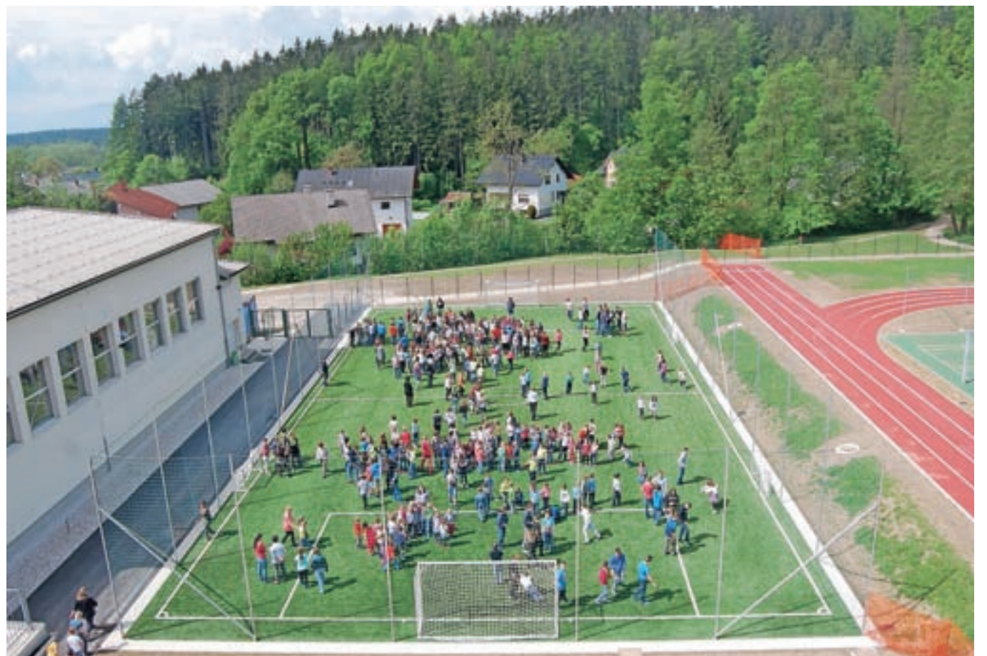
Šolarji prvič na novem nogometnem igrišču

da nas, če ne prej, konec marca spustijo migat na svež zrak. Marca se ni izšlo, zato pa smo v začetku maja enkrat med glavnim odmorom lahko vsi kar v copatih prvič zakorakali na umetno travo nogometnega igrišča. Sicer le za nekaj minut, za fotografijo, a nasmejani obrazi so dali vedeti, da je tudi to veliko doživetje. Nestrpno že čakamo 1. junij in slovesno odprtje novih igrišč, ki jih bomo v zadnjem mesecu pred poletnimi počitnicami zagotovo temeljito preizkusili.