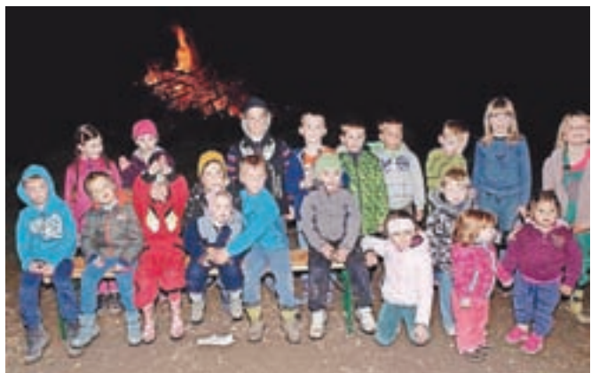
Druženje ob kresu v Kokri